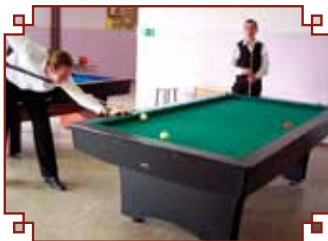
Mistrzostwa Polski Juniorów w Karambol