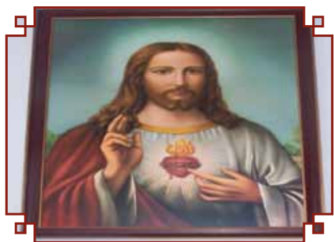
Pamiątka zawierzenia parafii i jej rodzin oraz Zespołu Szkół Sercu Jezusowemu maj 2006 r.