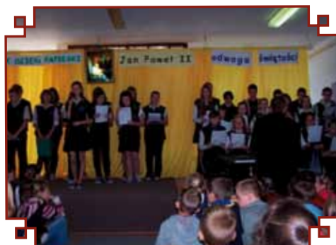
Obchody Dnia Papieskiego

Życie szkoły to również wycieczki turystyczno – krajoznawcze oraz... Mistrzostwa Polski w Karambol (odmiana bilardu).