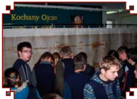
Kopia Całunu Turyńskiego w ZS w Lutczy