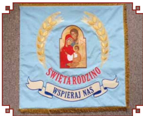
Rewers sztandaru Gimnazjum