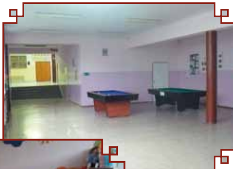
Korytarz na bloku dzieci starszych