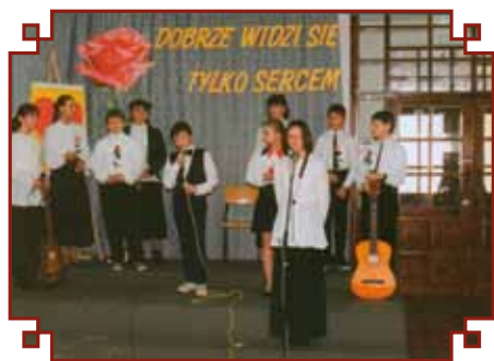
Występ młodzieży na uroczystości poświęcenia.