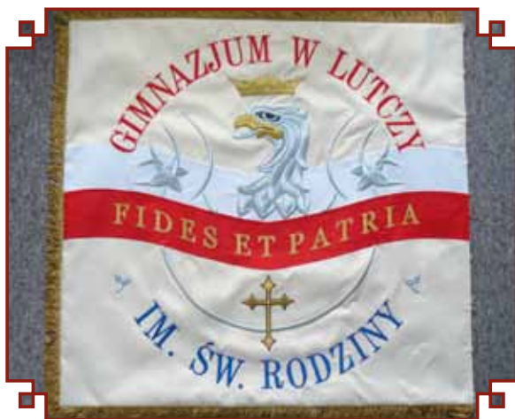
Awers sztandaru Gimnazjum

Na rewersie znajduje się haftowany wizerunek Świętej Rodziny otoczony kłosaми z siedmioma rzędami dojrzałych ziaren. Ma to symbolizować fakt, iż pełnię człowieczeństwa, pełnię dojrzałości, człowiek osiąga wzrastając w kochającej się rodzinie.