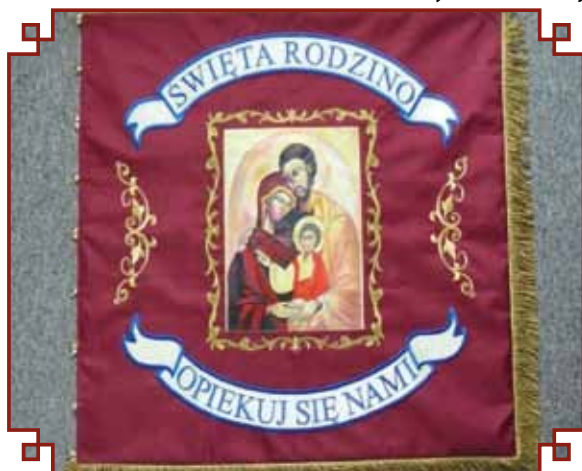
Rewers sztandaru Szkoły Podstawowej