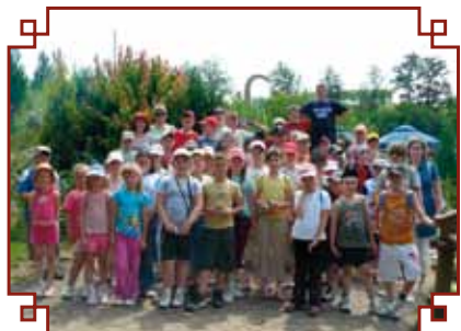
Wycieczka do Bałtowa