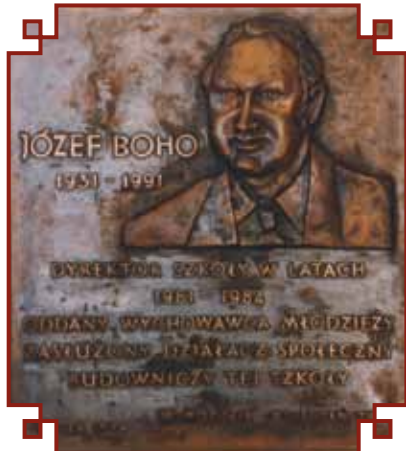
Honorowe miejsce na głównym koryta- rzu zajmuje tablica upamiętniająca Józefa Boho.