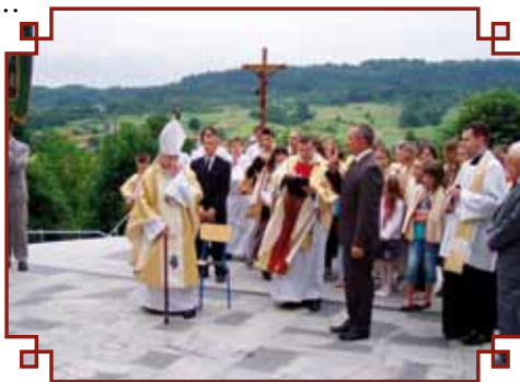
„Katyń – ocalić od zapomnienia” uroczystość sadzenia „dębów katyńskich”