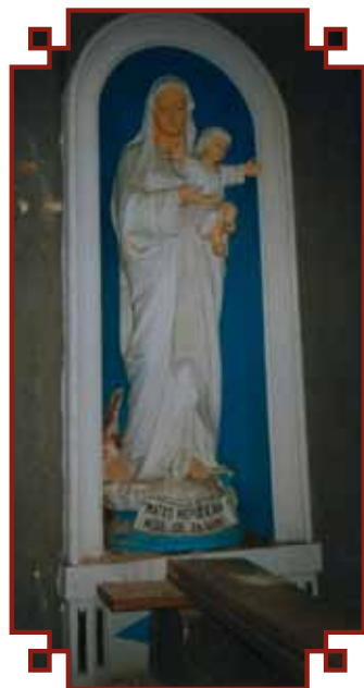
Figurka Matki Bożej Niepokalanej w starej szkole.