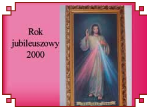
Rok jubileuszowy 2000 Obraz upamiętniający Rok Jubileuszowy 2000