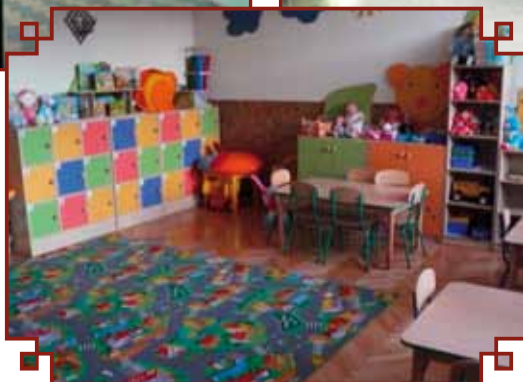
Sala dydaktyczna przedszkola