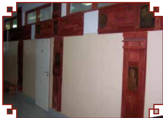
Dekoracje głównego korytarza

dła Polski z różnych epok, zabytki naszej miejscowości. Całość dekoracji skłania do refleksji nad historią kształtowania się państwowości polskiej, ma również wymiar edukacyjny.