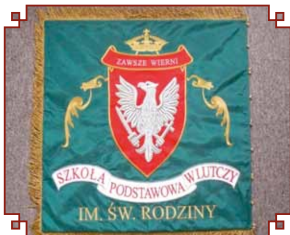
Awers sztandaru Szkoły Podstawowej

U dołu widnieje napis z nazwą szkoły. Na rewersie znajduje się obraz Świętej Rodziny otoczony zawołaniem „Święta Rodzino opiekuj się nami”.