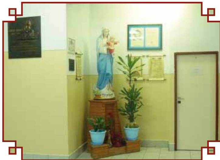
Obecny wygląd figury

Wchodzących do szkoły wita przeniesiona 2 grudnia 1996 r. ze starej szkoły Figura Matki Bożej Niepokalanej.