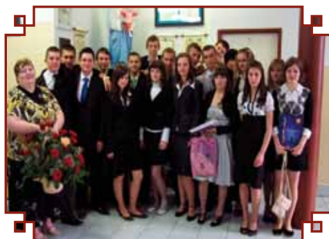
Klasa III gimnazjum z wychowawczynią - ukończenie szkoły

Życie szkoły to również wycieczki turystyczno – krajoznawcze oraz... Mistrzostwa Polski w Karambol (odmiana bilardu).