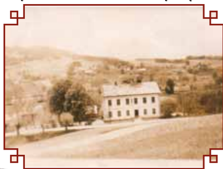
Stara szkoła wybudowana w latach 1896-99 (zdjęcie z 1956 r.)

Ożywieni więc wiarą w szczęśliwą przyszłość, ufni w moc i opiekę Najwyższego, obejmując duchem miłości dzisiejsze i przyszłe nasze pokolenia, przystępujemy dziś z modlitwą na ustach do położenia „Kamienia Węgielnego” pod ten przybytek Oświaty z życzeniem aby w murach jego wychowywała i kształciła się młodzież Katolicka na większą cześć i chwałę Bożą i na pożytek drogiej naszej Ojczyzny. Oby Najwyższy błogosławił raczył dziełu naszemu.