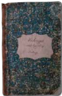
Księga historii szkoły z 1863 roku