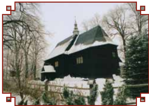
Kościół z XV w. na Małówce

Lutcza, wieś i parafia XIV wieczna. Pierwsze wzmianki o Lutczy w dokumentach pochodzą z 1347 roku gdy wymieniona jest w rejestrze opłacających świętopietrze oraz w dokumencie nadania Czadorowi z Potoka w 1390 roku. Natomiast historia szkolnictwa sięga XVI w. kiedy to istniała szkółka parafialna, która dysponowała budynkiem. Znani są