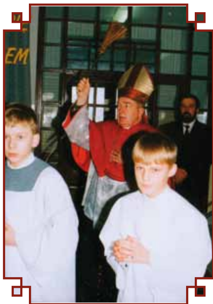
Poświęcenie szkoły przez ks. Bp Kazimierza Górnego

Liceum Sztuk Plastycznych w Rzeszowie. Wykonał je w drewnie przez co nawiązują do tradycji wsi polskiej, przydrożnych kapliczek, zabytkowego domrzewiowego kościółka.