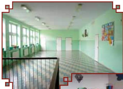
Korytarz na bloku dzieci młodszych

Dzieci i młodzież oprócz bardzo dobrze wyposażonych sal lekcyjnych mają do dyspozycji przestronne korytarze.